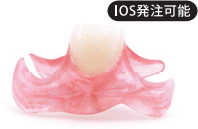
ソケットプラス (1~3 歯欠損)