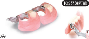
コネクト M (2~13 歯欠損)